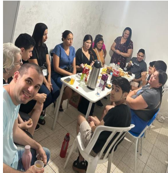
09/12/2025 – Terça-feira