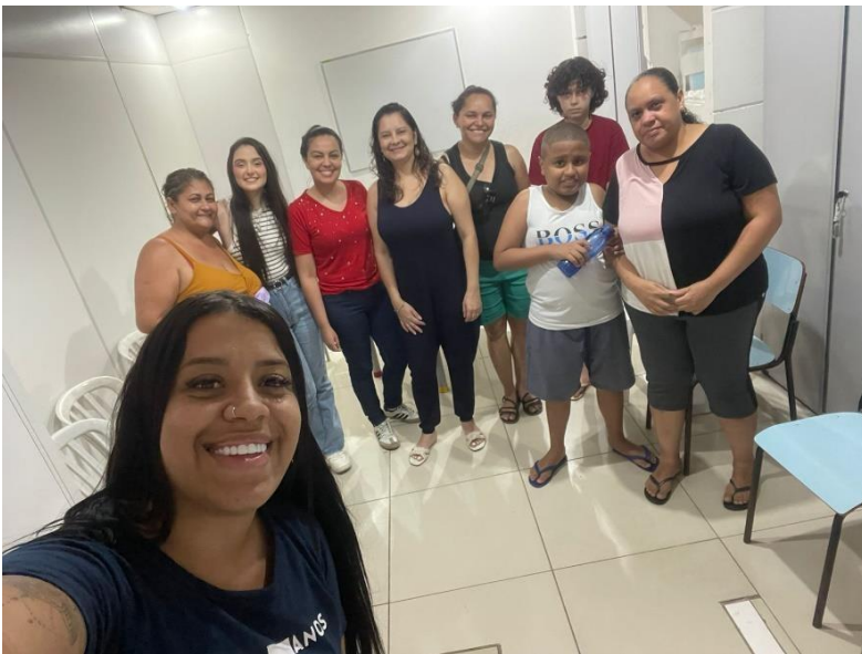
11/12/2025 – Quinta-feira